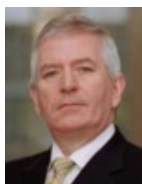
Charles McCreevy , commissaire européen