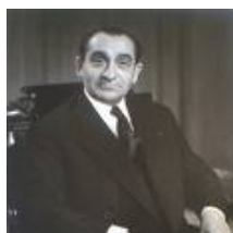
Pierre Mendès France

En France, une telle démarche est aujourd'hui impossible. En effet, selon la Commission de Bruxelles, la France n'a pas le droit de limiter les investissements étrangers. (voir la note à ce sujet [1] ).